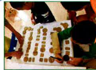
自分達で作った すころく